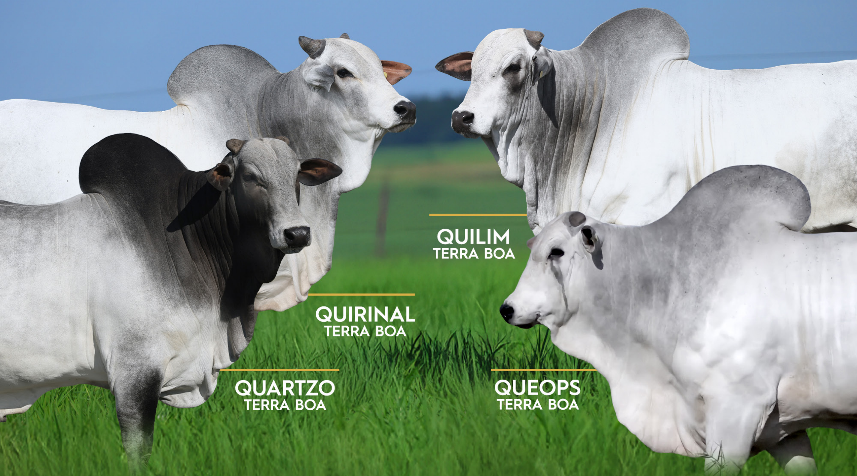
QUILIM TERRA BOA